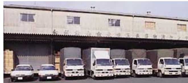
本社・物流センター