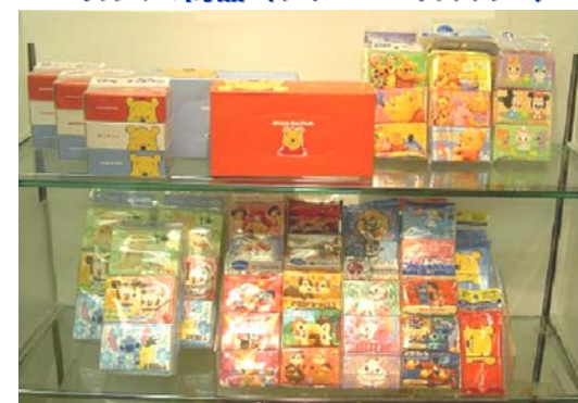
オリジナル商品 (ディズニー・キャラクター)