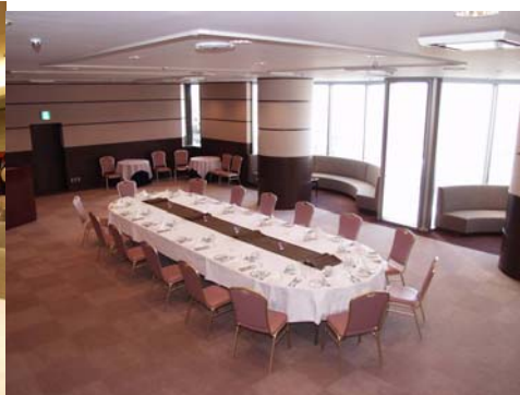
宴会場ルネッタ（サロン）