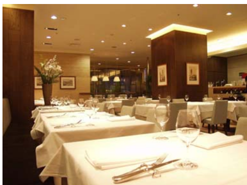
レストラン オルト